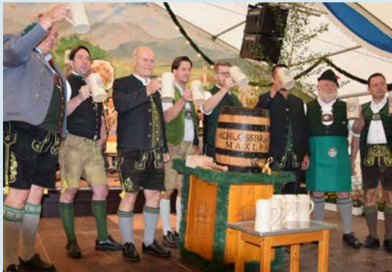
Ozapft' is - 10 Festtage mit dem süffigen Maxtrainer Volksfestbier