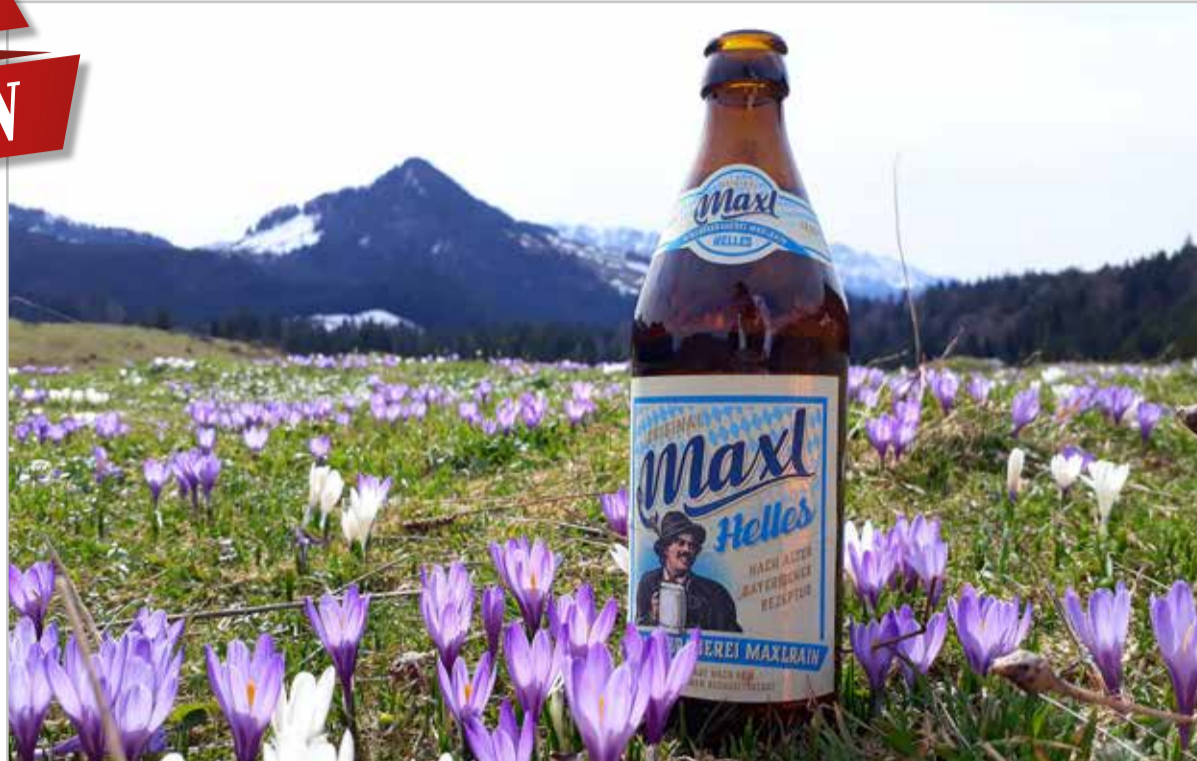
Ästhetik pur: Frühlingserwachen mit Krokusblüten und MAXL auf dem Heuberg (Danke an Martina)