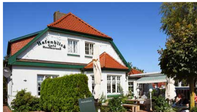
Ein Schmuckstück - von Außen wie von Innen