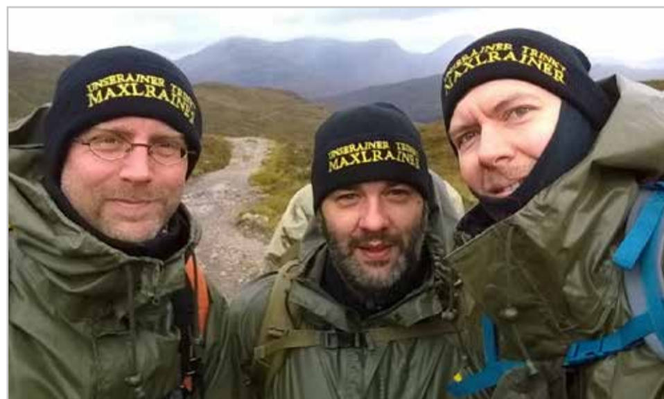
Auch in Schottland war die MAXLRAINER Mütze ein wichtiger Begleiter. Nach den Jacken zu urteilen gehen die Drei nicht nur zusammen in den Getränkemarkt einkaufen. (Dank an Andreas Meier)