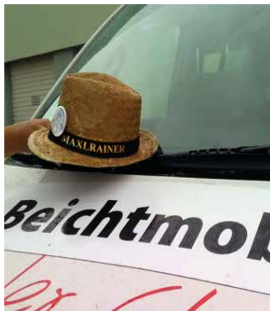
„Kirche und a gscheids Bier, des passt,“ sagt Annemarie Kosel nach der Pfingstwallfahrt nach Altötting mit dem „Beichtmobil“