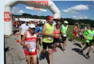
Der Volksfestlauf - jetzt anmelden und mitmachen