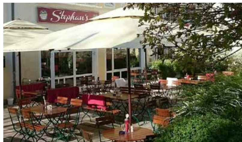
Ideal für warme Sommerabende: Stephan's Biergarten / stilvoll und gemütlich: der Gastraum