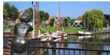
Blick auf den Museumshafen / Die große Sonnenterrasse