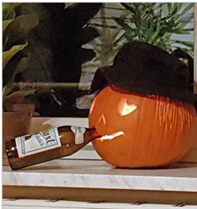
Über Halloween mag man denken was man will - hier machen wir eine Ausnahme.