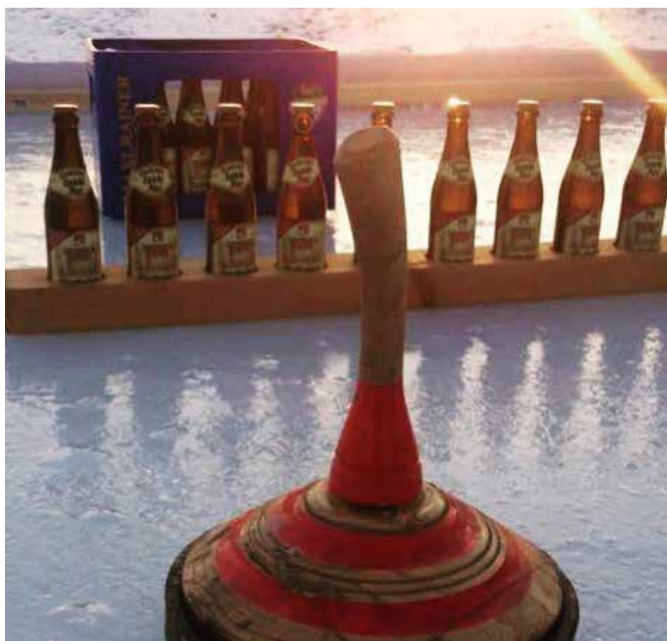
Auf der selbstgemachten Eisfläche (4mx20m) im Garten von Sabine Schlosser, darf beim abendlichen Eisstockschiessen natürlich auch das Zielwasser nicht fehlen!