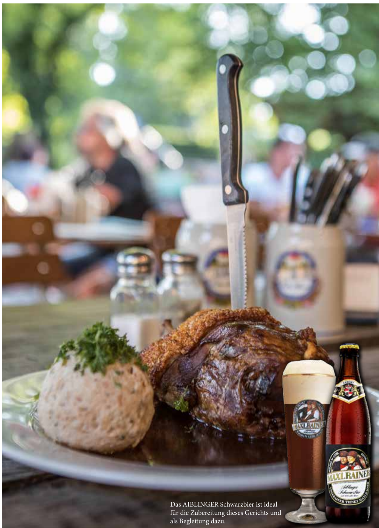
Das AIBLINGER Schwarzbier ist ideal für die Zubereitung dieses Gerichts und als Begleitung dazu.