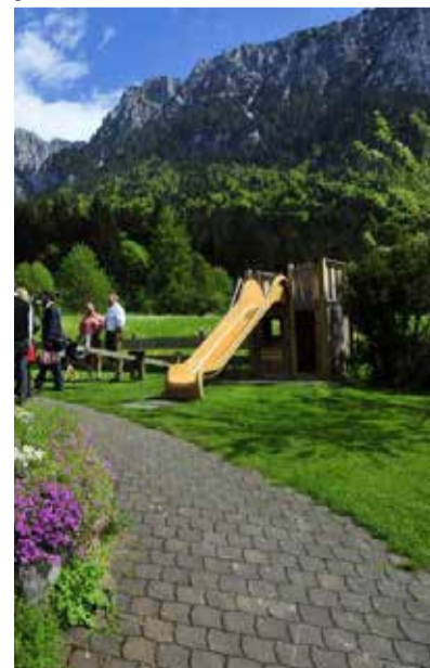
Immer gut gelaunt - die Zacherls