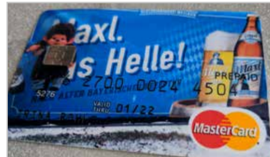
Nicht nur für den Einkauf im Getränkemarkt!