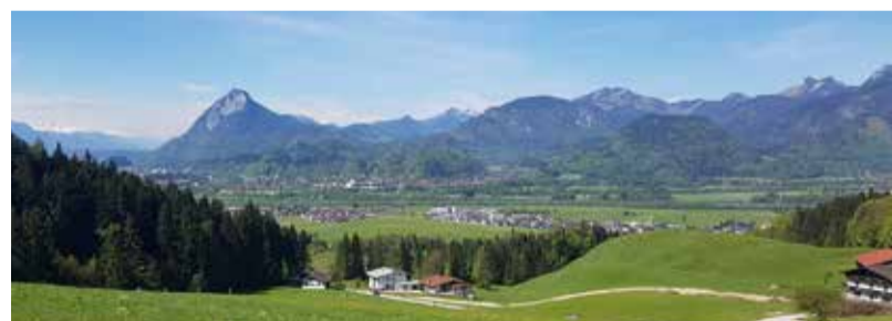
Einzigartiger Blick vom Café Zacherl auf das Kaisergebirge

Betriebsurlaub von 18. Juni bis einschließlich 5. Juli 2018