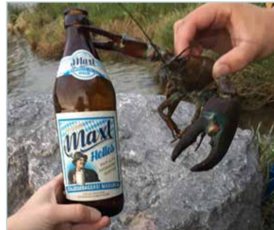
Könnte die nächste Kastenzugabe werden: Der lebendige Flaschenöffner Danke an Patrick Uhl