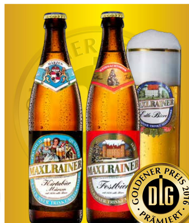
Kirtabier / Festbier