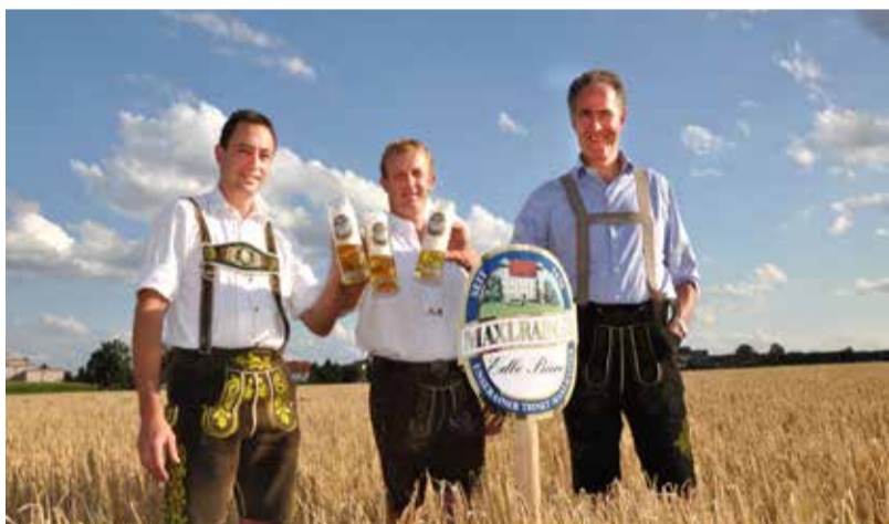
Links oben: Das Maxlrainer Brauhaus