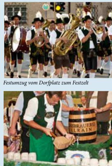
Festumzug vom Dorfplatz zum Festzelt