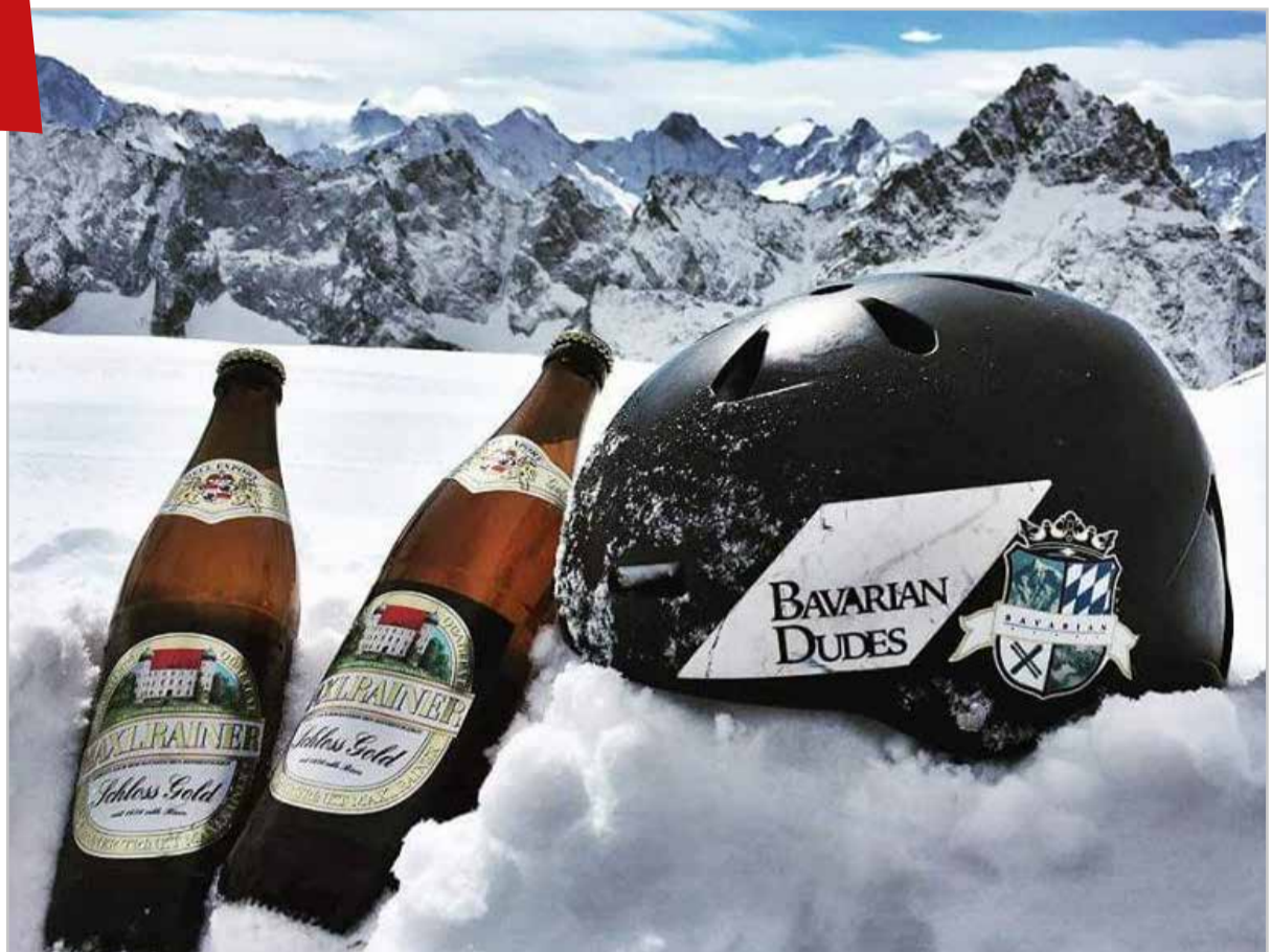
Die Bavarian Dudes - Siegerbier nach der gewonnenen Meisterschaft im Buckelpistenfahren