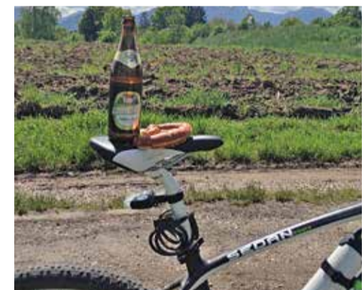
Typische Bikernahrung in Oberbayern