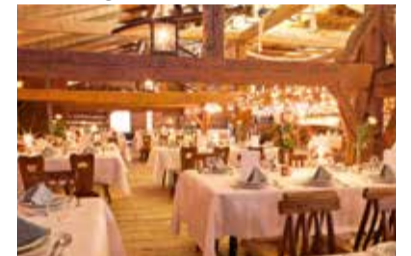
Blick in den Stadel