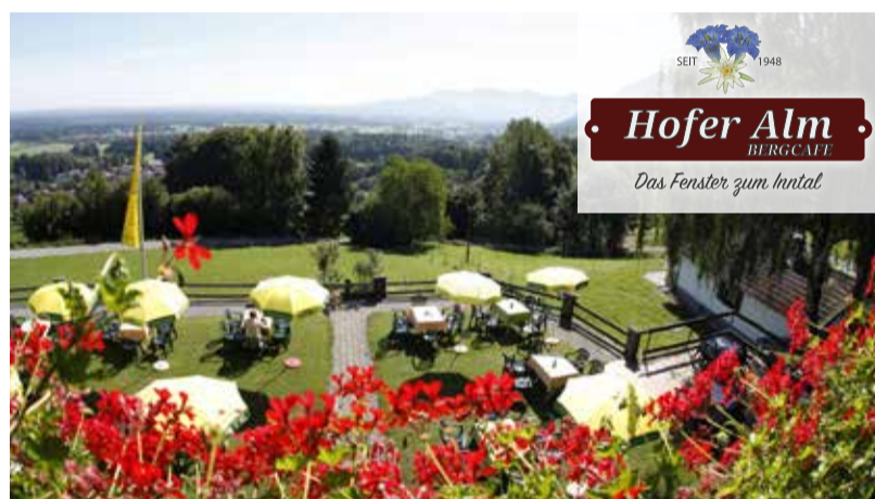
Atemberaubender Blick ins Inntal

Öffnungszeiten: Mo - So: 10 bis 22 Uhr Donnerstags Ruhetag (außer an Feiertagen)