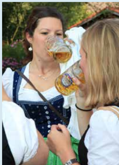
In Feldkirchen schmeckt das Bier.