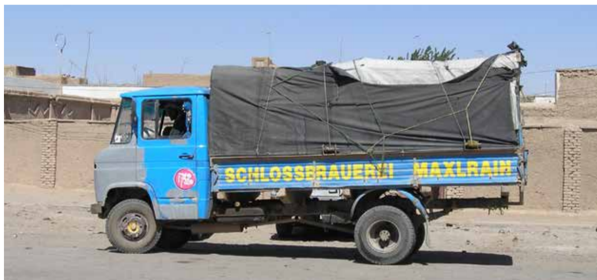
Oben: Foto von Bert Praxenthaler in der „Bierwüste“ Herat, Afghanistan