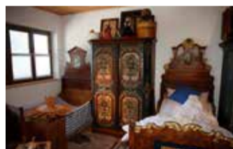
Das kleine Hofmuseum