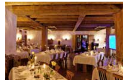
Der ehemalige Kuhstall

HASENÖHRL HOF Geitau 5 / 83735 Bayrischzell Tel.: 080 23 / 81 93 344 info@hasenoehrl.de www.hasenoehrl.de