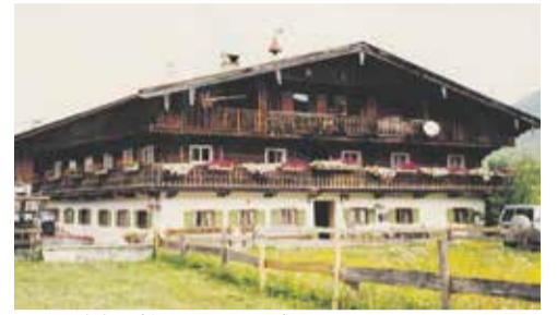
Hasenöhrl-Hof (Unteröstner-Hof) ca. 1970