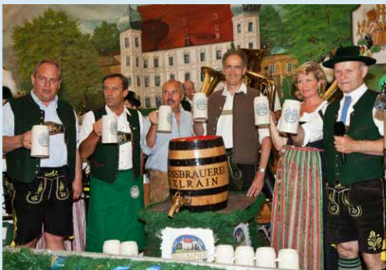
Ozapf' is - 9 Festtage mit dem süffigen Maxtrainer Volksfestbier