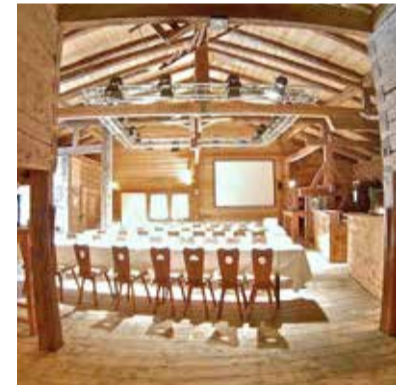
Blick in den Tagungsraum / Stadel