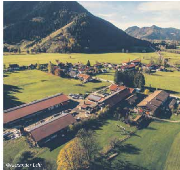
Blick über den Hasenöhrl-Hof

Wer heute die Geschichte der Wiederauferstehung dieses Hofes hört, kann nur den Hut ziehen. Denn das finanzielle Risiko, die Kosten und die deshalb notwendige Eigenleistung über Monate und Jahre ist mehr als beachtlich - und so ist das Ergebnis. Der wunderschöne historische Hof stammt aus dem Jahre 1516 und umfasst 20 Hektar Grund inmitten einer „fast kitschigen Idylle“. Der Hof war bis zuletzt land-